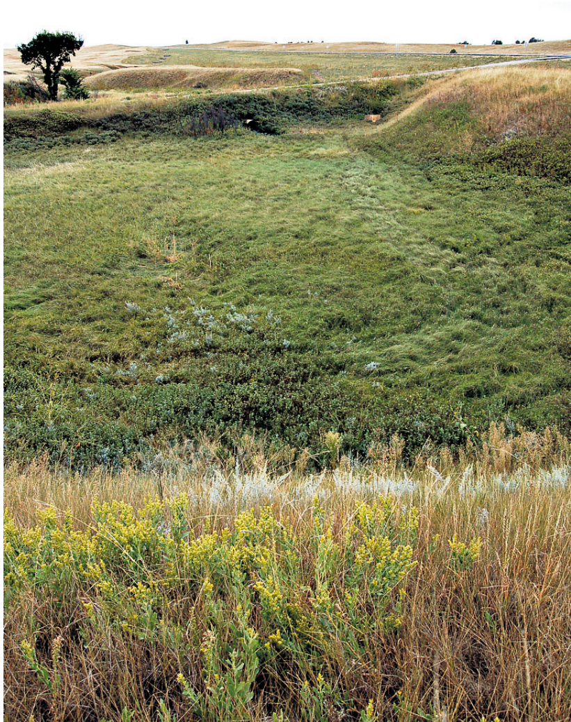
Wounded Knee: Etter kraftige regnskyll kan man fortsatt finne beinrester etter levninger fra ofrene som aldri ble lagt i noen ordentlig grav.